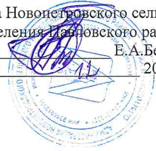
СХЕМА размещения ярмарки ст.Новопетровская

УТВЕРЖДАЮ: Глава Новопетровского сельского поселения Павловского района Е.А.Бессонов « 22 » _____ 2020 года